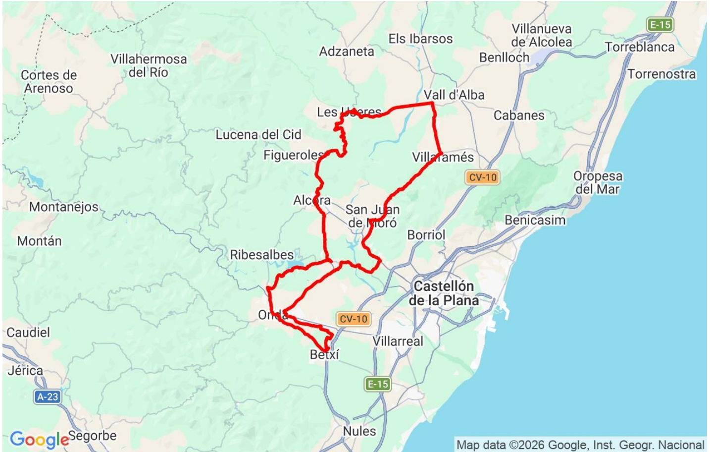
Map data ©2026 Google, Inst. Geogr. Nacional